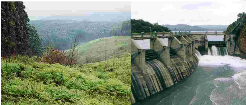
Die Waterbronbestuurheffing sal gehêf word vir onttrekking van water uit waterhulpbronne en vir stroomvloeivermindering bv. 'n bosbou aktiwiteit.